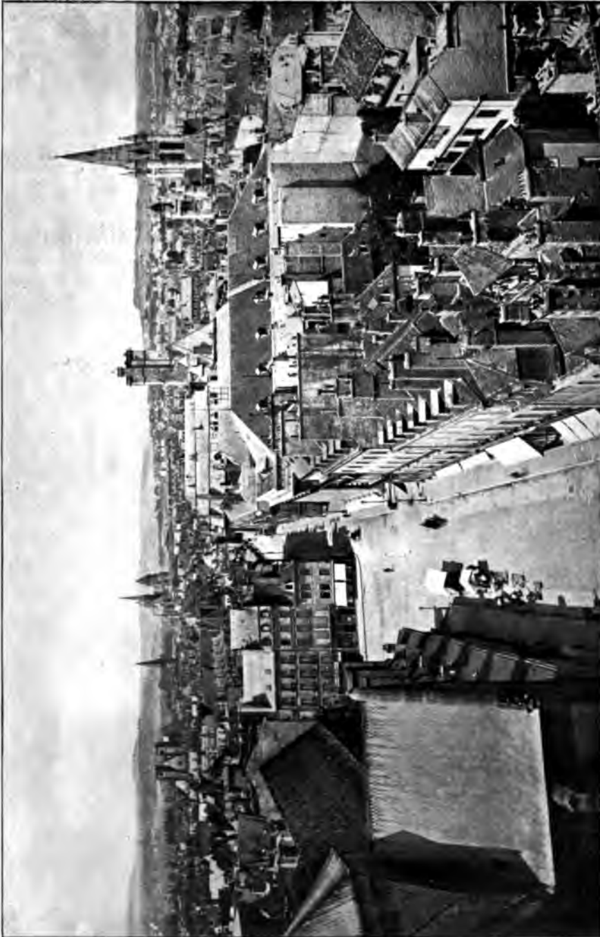
Clu. in. Neudun.